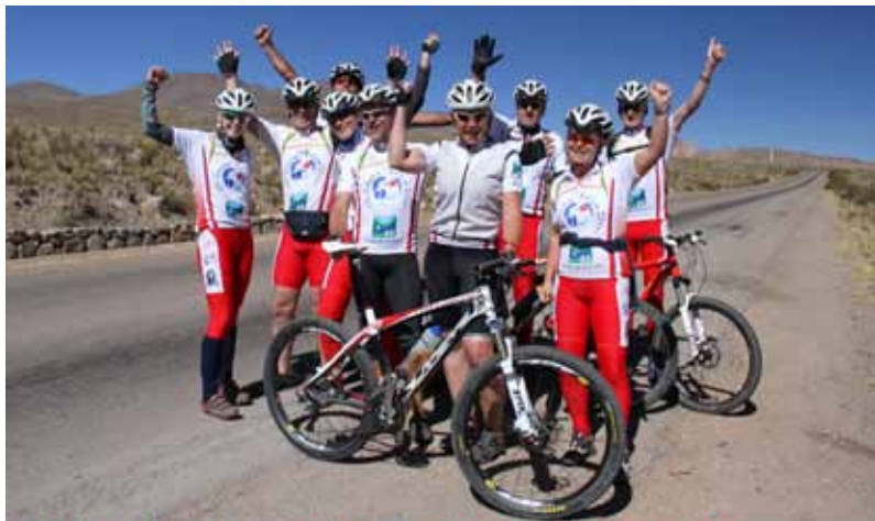
... så endelig var vi på rett vei igjen - fra Potosi mot TicaTica 28.7.11 ... blå himmel, kulde men varme i sofen.